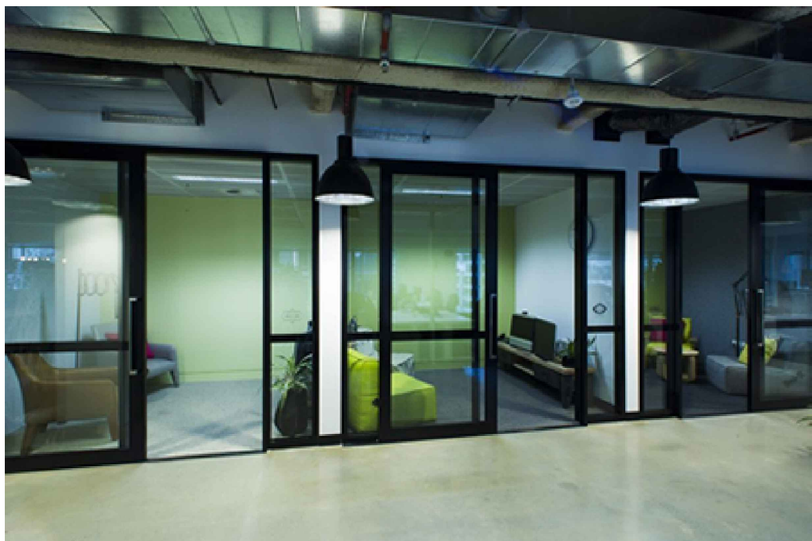
DETALHE DE ESTRUTURA DE ESQUADRIAS EM ALUMINIO

TODAS AS ESQUADRIAS TIPO DIVISÓRIAS DE VIDRO DEVERÃO ESTAR FIXADAS COM PONTALHETES E CHUMBADORES ADEQUADOS AO FABRICANTE DOS MONTANTES. ESTES DEVERÃO SEGUIR NORMA: NBR ISO 9001, NBR ISO 14001 e NBR ISO 45001. E a certificação ASI (Aluminium Stewardship Initiative), o mais importante Selo de Sustentabilidade na cadeia de valor do alumínio.